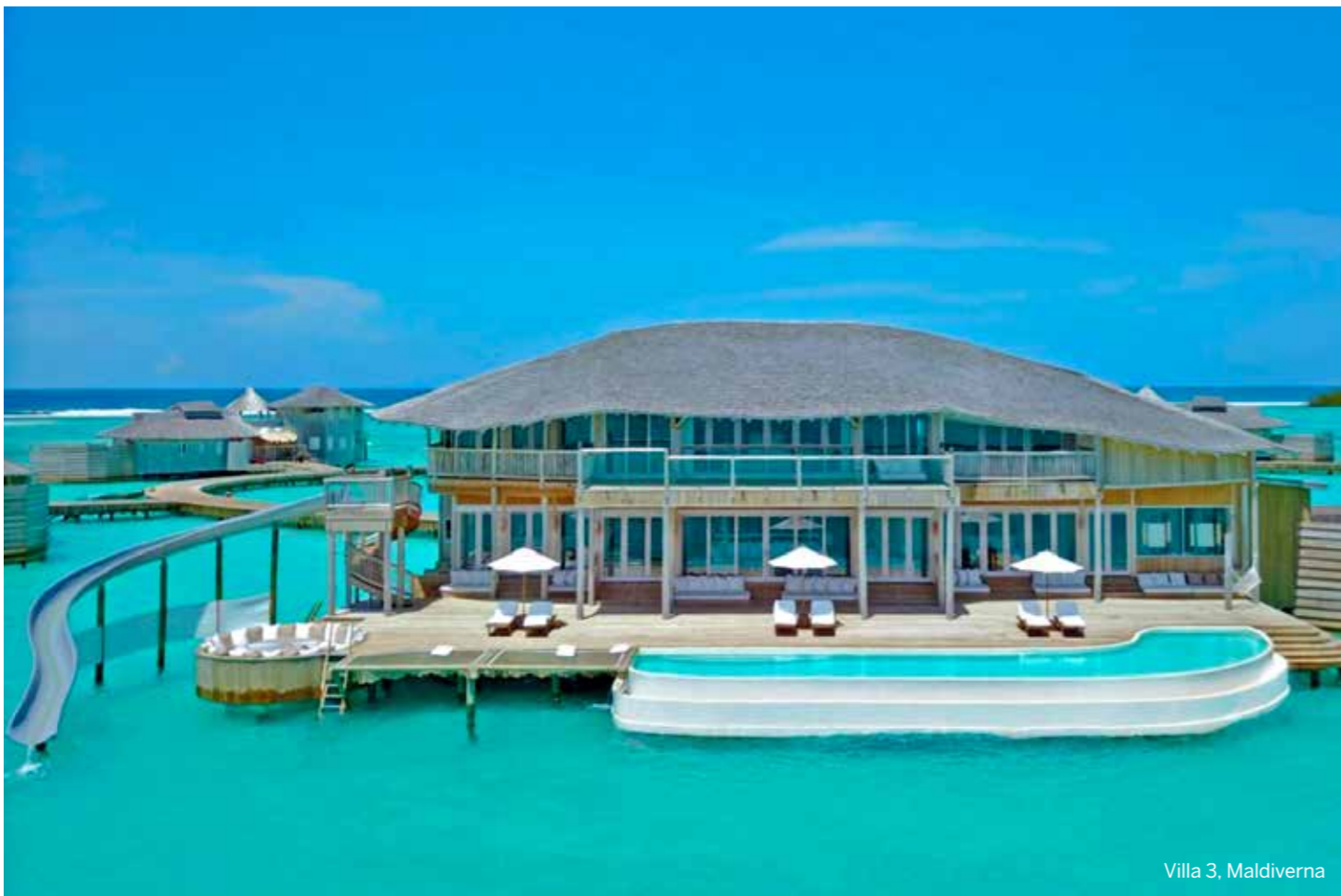
Villa 3, Maldiverna