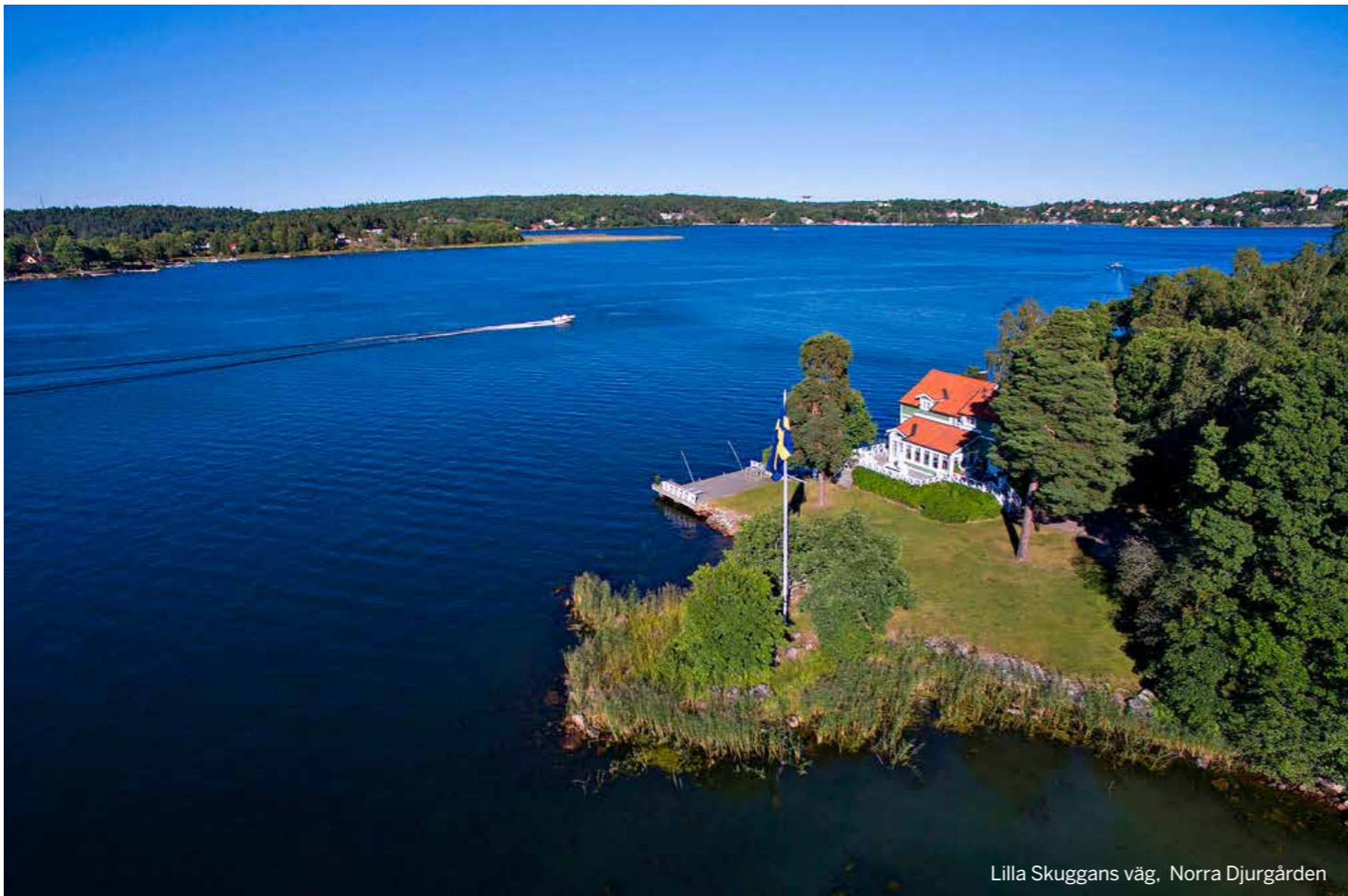
Lilla Skuggans väg, Norra Djurgården