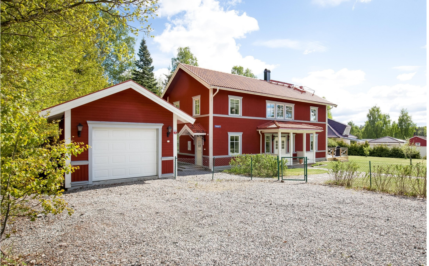
Falkvägen 77, Eskilstuna, 6 rok, 182 kvm, 4 195 000 kr -> 4 500 000 kr