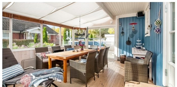
Vikstavägen 20, Skogstorp, 4 rok, 117 kvm 2 995 000 kr -> 3 510 000 kr