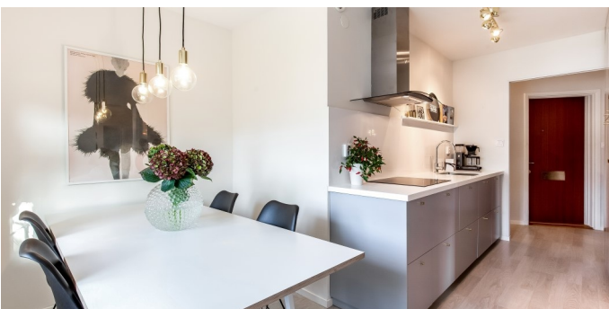
Krongatan 7, Eskilstuna, 3 rok, 80,6 kvm 1 675 000 kr -> 1 850 000 kr