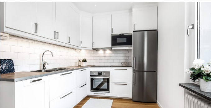
Grängsgatan 24B, Eskilstuna, 2 rok, 56 kvm, 1 250 000 kr -> 1 500 000 kr