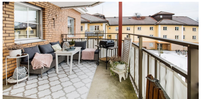
Rothoffsvägen 18B, Eskilstuna, 3 rok, 79 kvm, 1 695 000 kr -> 2 060 000 kr