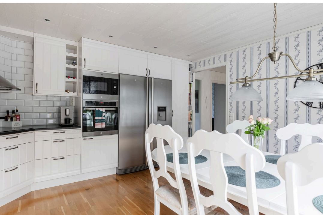
FINT KÖK I MODERN STIL