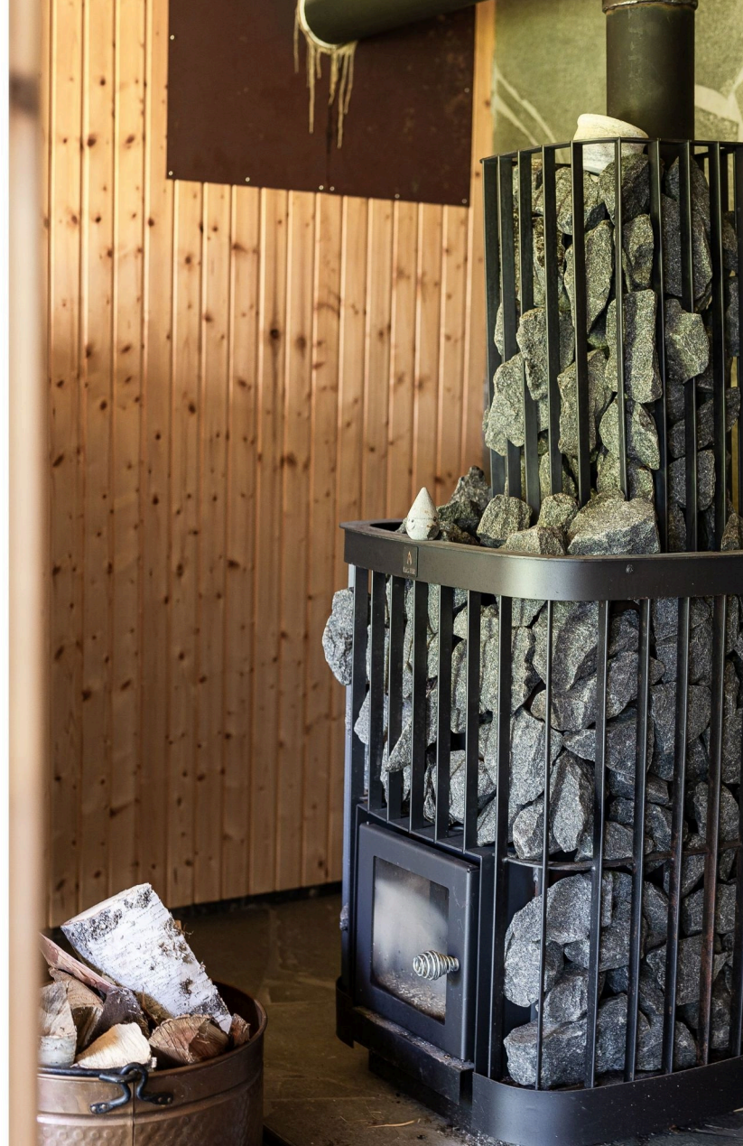
VEDELDAD BASTU MED EGEN UTGÅNG