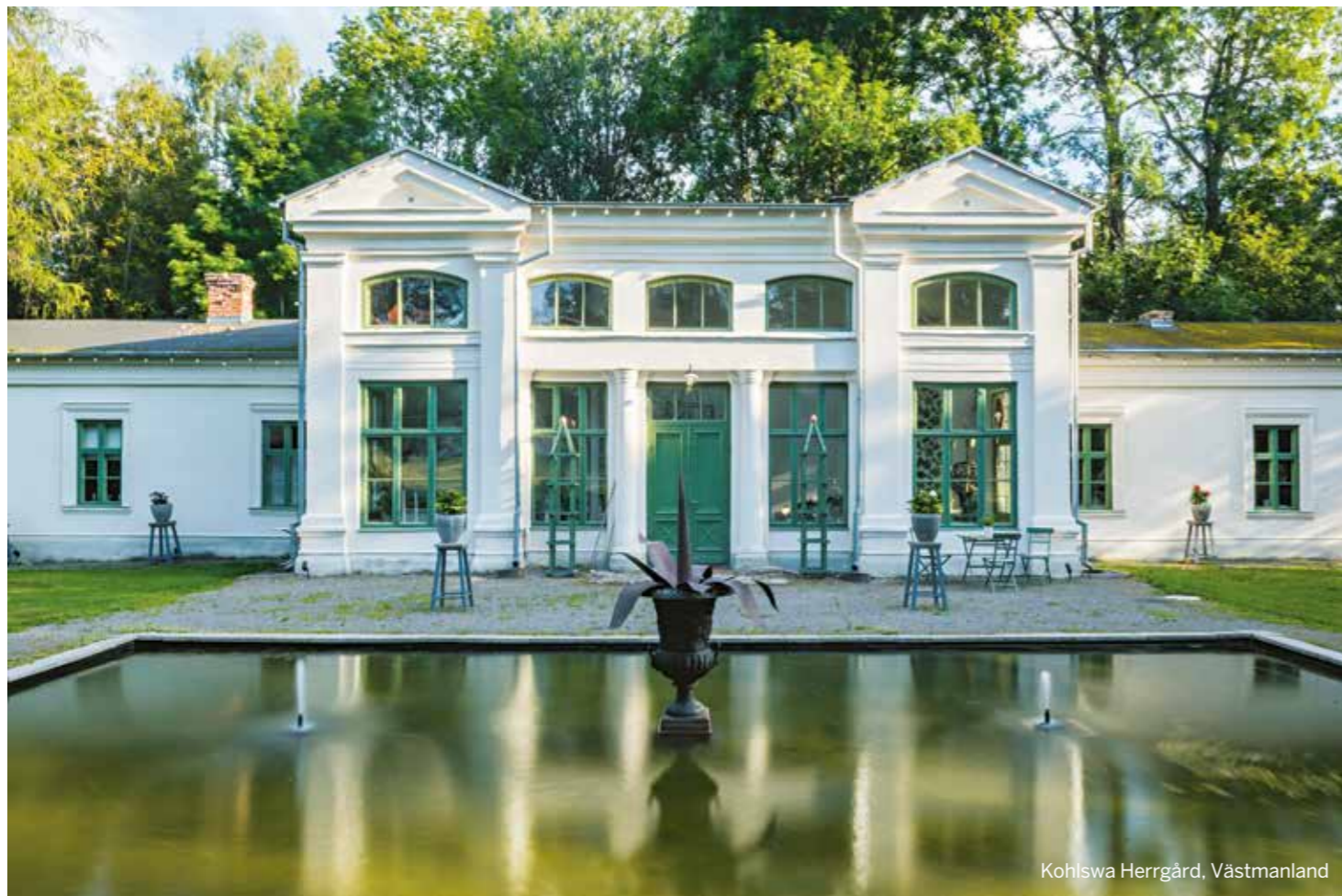
Kohlswa Herrgård, Västmanland