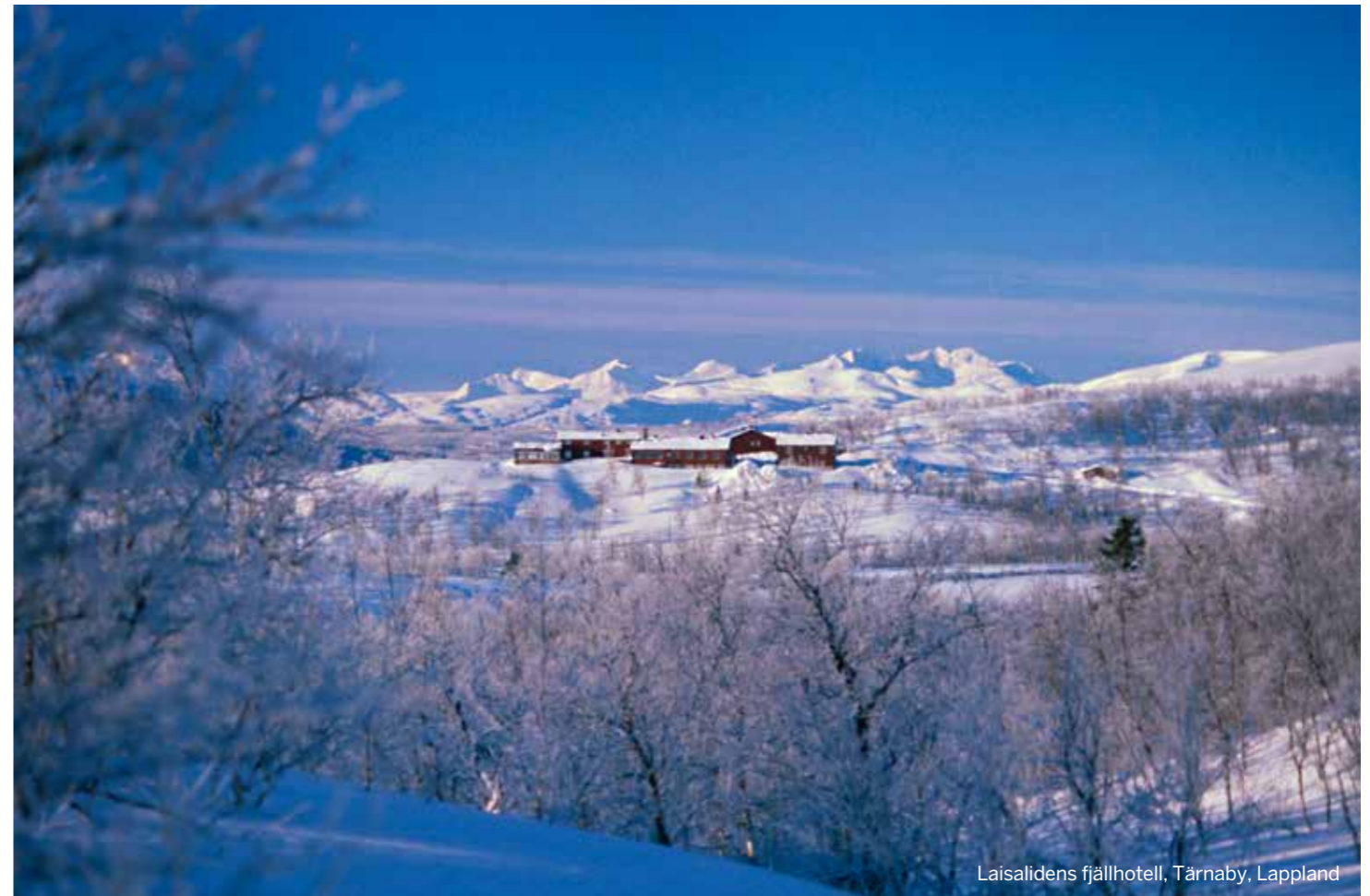
Laisalidens fjällhotell, Tärnaby, Lappland