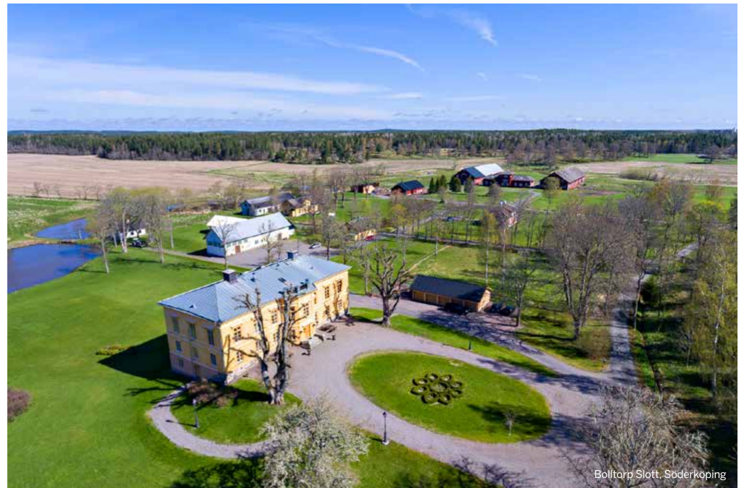
Bolltorp Slott, Söderköping