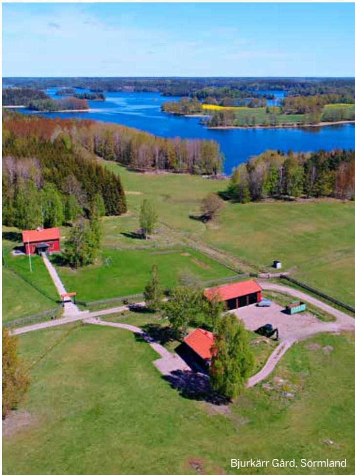
Bjurkär Gård, Sörmland