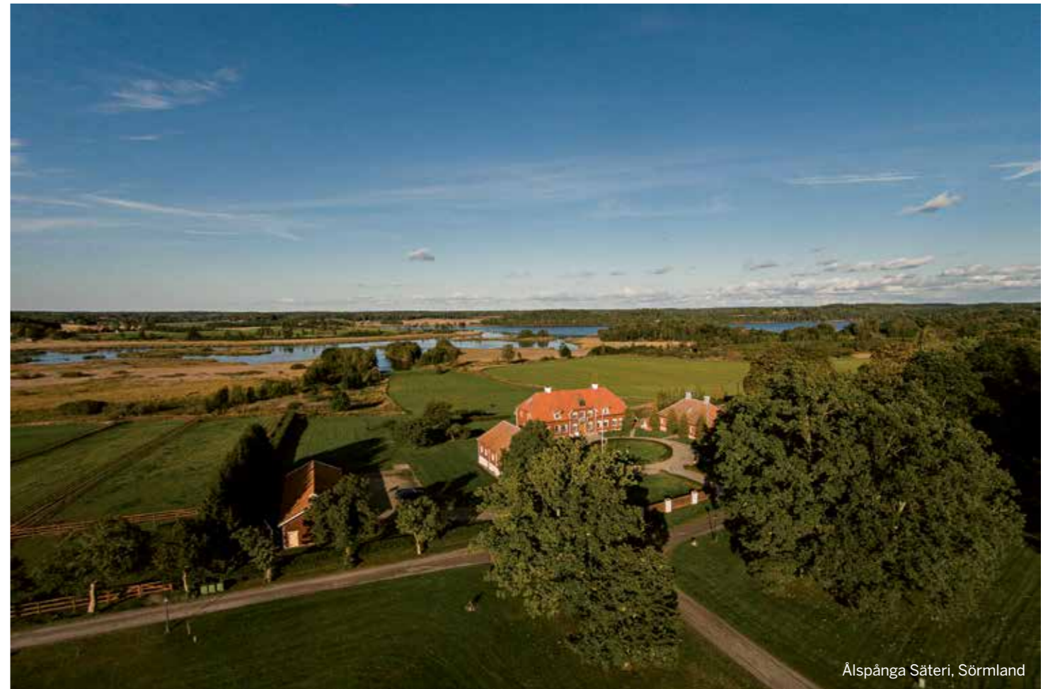
Ålspånga Säteri, Sörmland