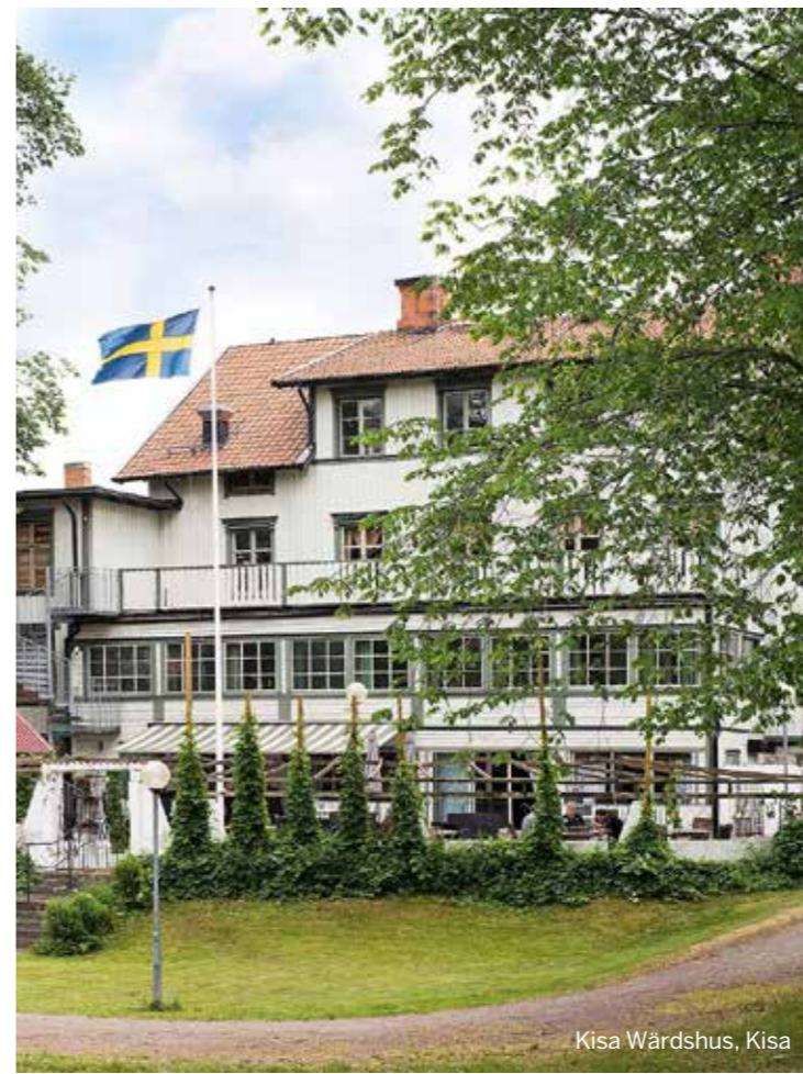
Kisa Wårdshus, Kisa