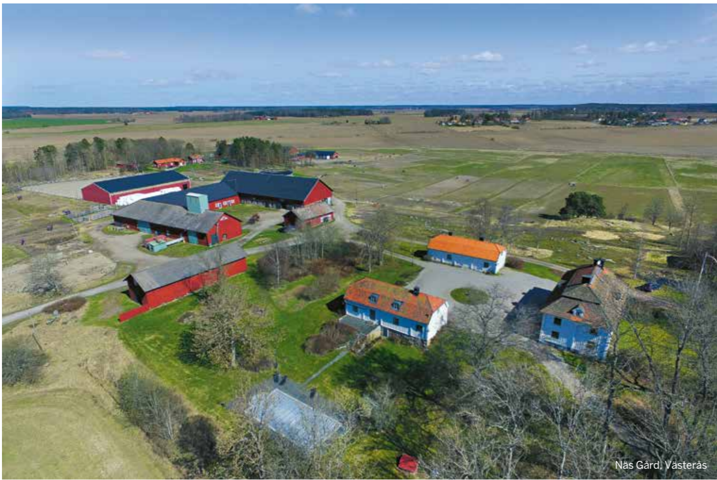
Näs Gård, Västerås