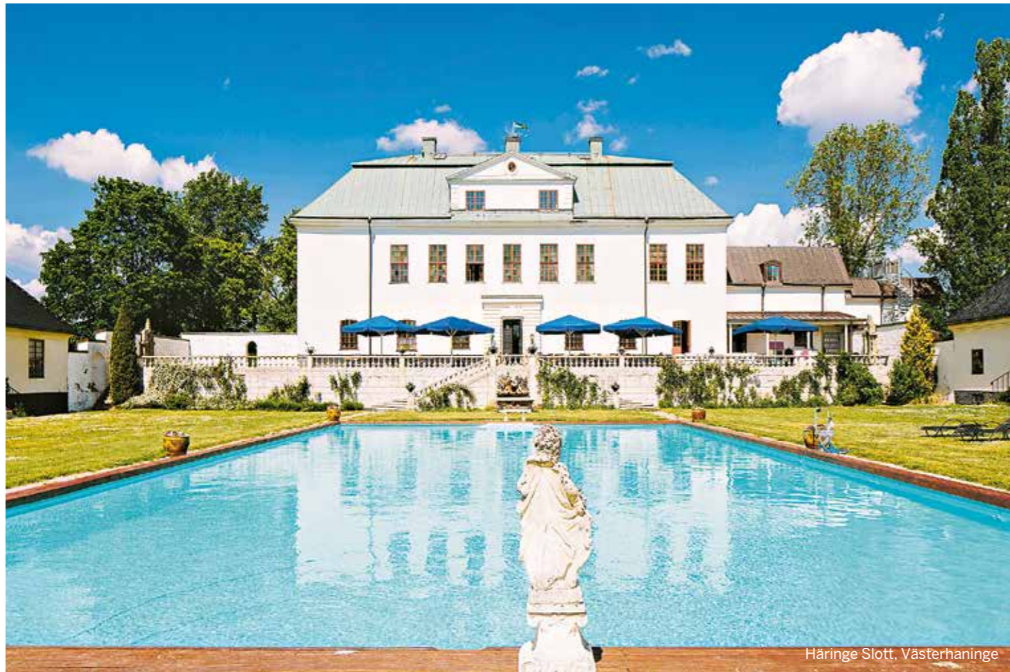
Häringe Slott, Västerhaninge