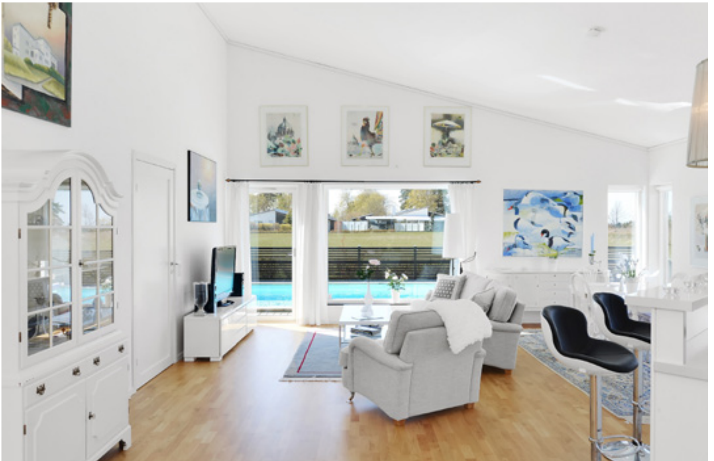
Huset är i ett plan med en öppen planlösning för socialt umgänge.