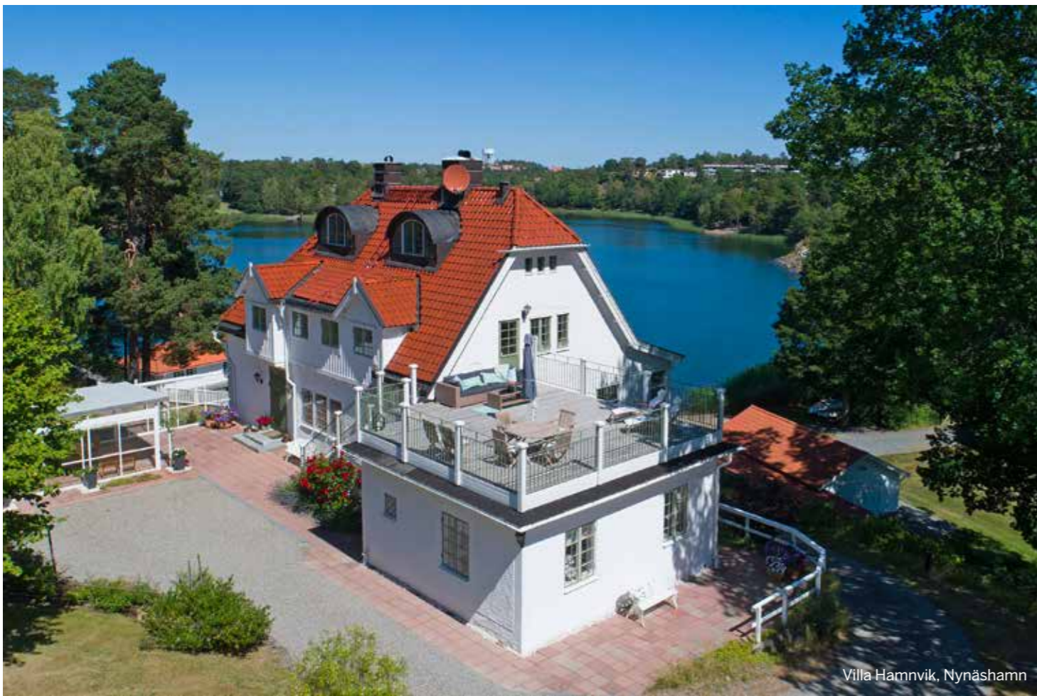
Villa Hamnvik, Nynäshamn