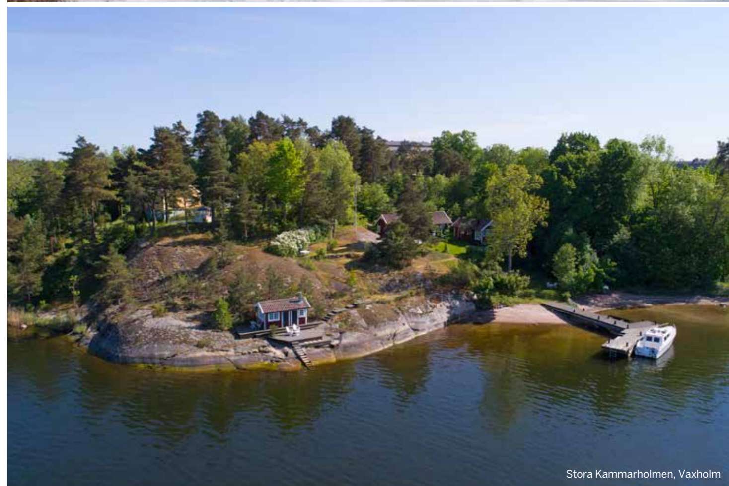
Stora Kammarholmen, Vaxholm