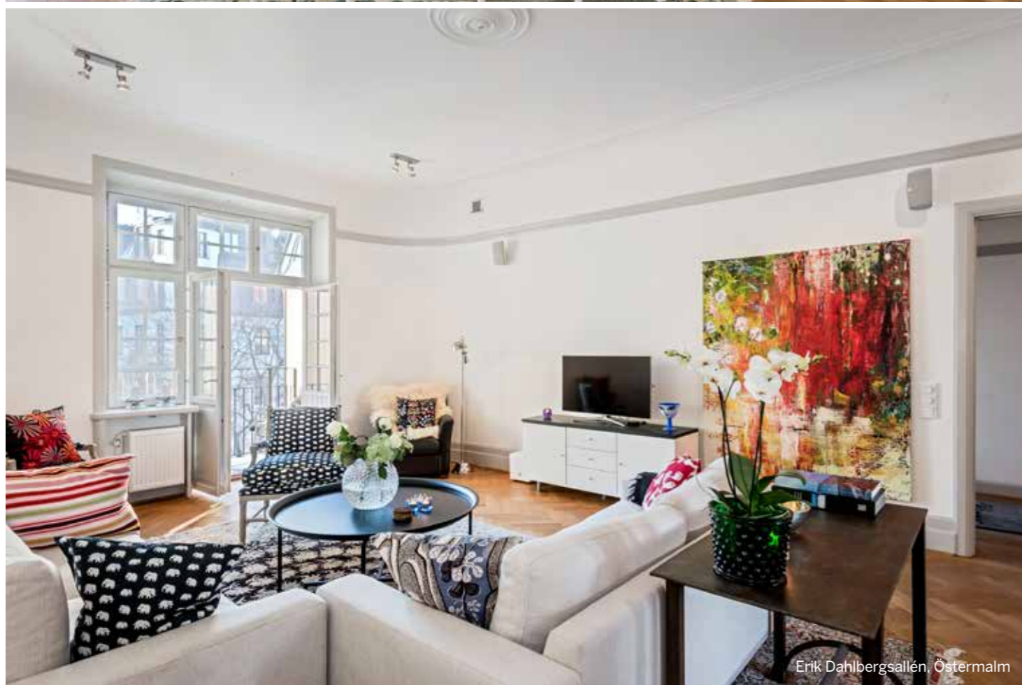
Erik Dahlbergsallén, Östermalm